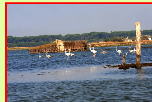
Fenicotteri in Pialassa Baiona

TESTIMONIANZE - pietra artistica, all'imbocco del Taglio. ⑨ Di qui passaggio di Garibaldi e Leggero, su un battello di fortuna condotto dal soccorritore Sumarén , lungo il canale fino allo sbocco in Pialassa.