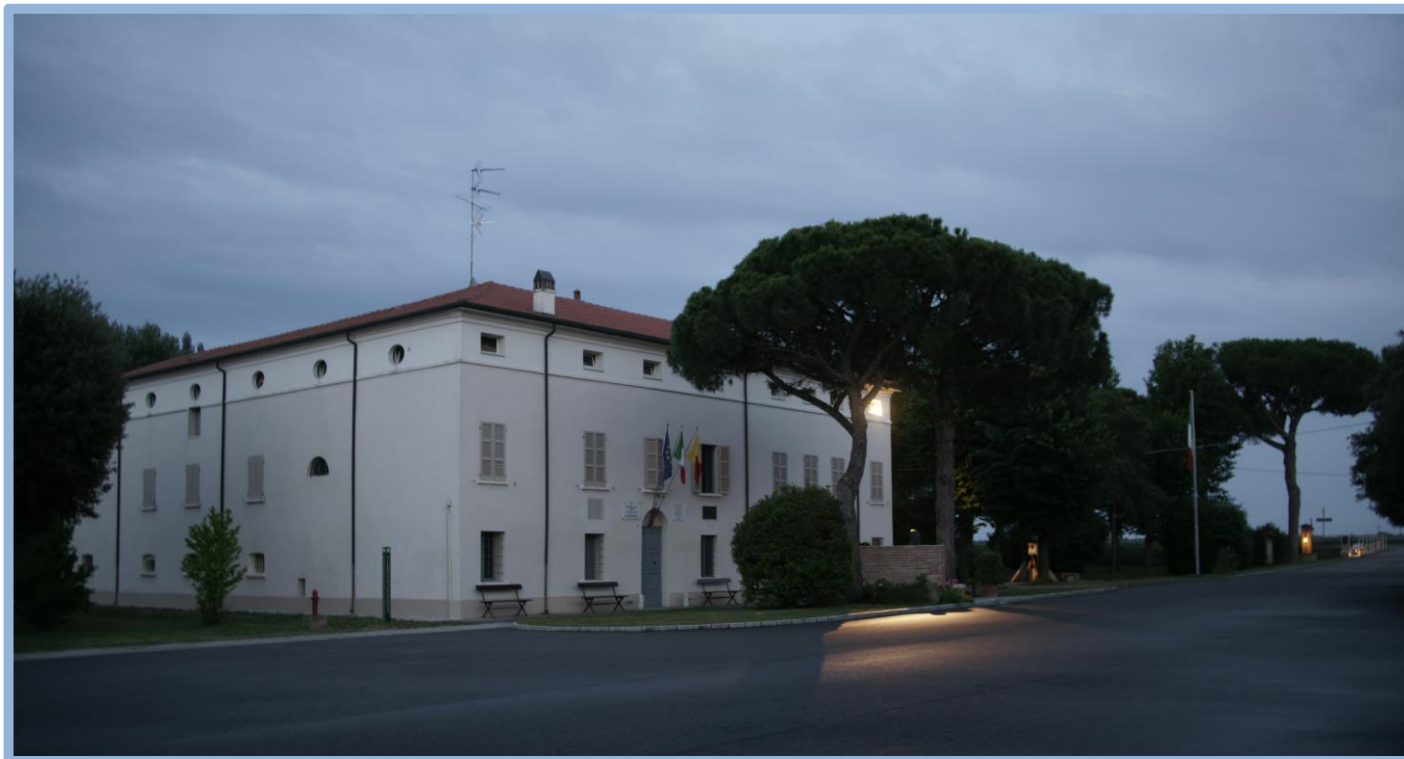
Fattoria Guiccioli - Casa ove morì Anita Garibaldi Mandriole Ravenna

Federazione delle Cooperative della Provincia di Ravenna Fondata nel 1902